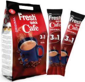
FRESH QUICK CAFE ORIGINAL 3in1 18 GR

SICAK İÇECEKLER / HOT DRINKS / مشروبات ساخنة BOISSONS CHAUDES / Горячие напитки