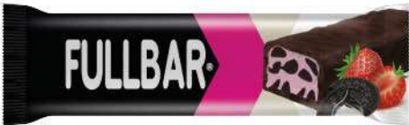
COCOA COATED STRAWBERRY FLAVOUR INNER FILLED BISCUIT COCOLIN