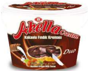
AKELLA SPREAD CREAM CHOCOLATE DUO 400 GR