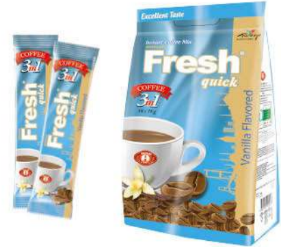
FRESH QUICK COFFEE 3 IN 1 WITH VANILLA 18 GR