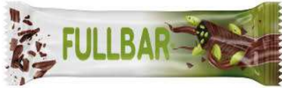
COCOA COATED BITTER FILLED WITH PISTACHIO PARTICULATE COCOLIN 60 GR