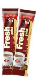
FRESH QUICK COFFEE 3 in 1-18 GR