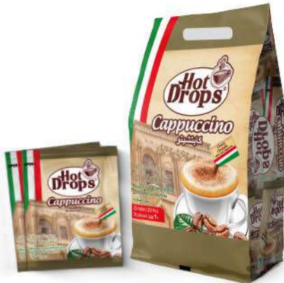
HOT DROPS GRANULE CAPPUCCINO 25 GR