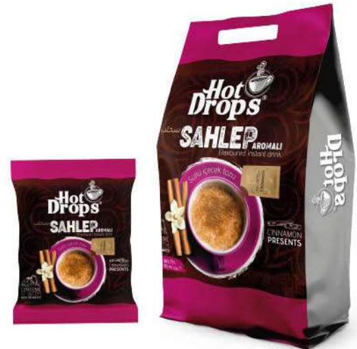
HOT DROPS SAHLEP 20 GR