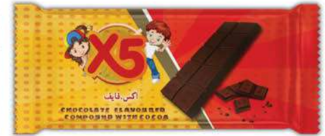
X5 CHOCOLATE FLAVOURED COMPOUND WITH COCOA 25 GR