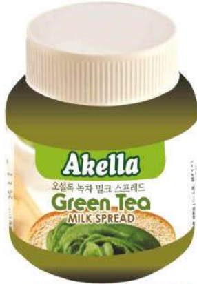
AKELLA GREEN TEEA SPREAD 350 GR