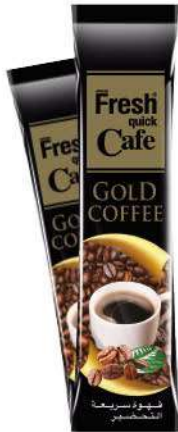
FRESH QUICK COFFEE GOLD 2 GR