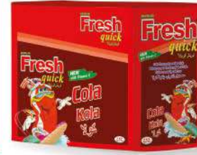
FRESH QUICK POWDER DRINK COLA 9 GR