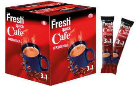
FRESH QUICK CAFE ORIGINAL 3in1 18 GR