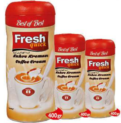
FRESH QUICK COFFEE CREAM 400 GR