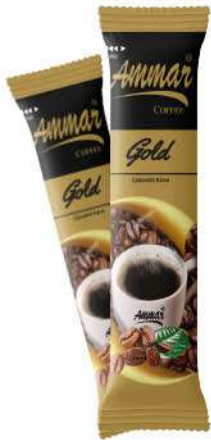
AMMAR COFFEE GOLD 2 GR