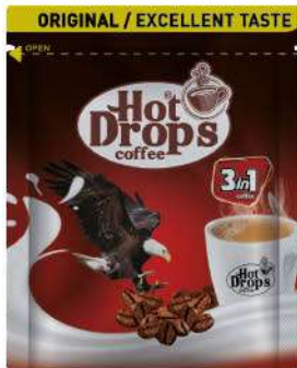
HOR DROPS COFFEE 3 IN 1 KARTLI