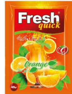
FRESH QUICK POWDER 45 GR / ORANGE