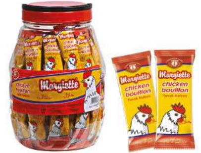
MARGIETTE POWDER CHICKEN BULYON PLASTIC KAVANOZ