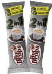
HOT DROPS 5ml BALLI ZENCEFİLLİ 18 GR