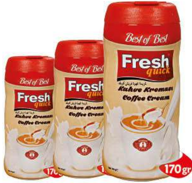
FRESH QUICK COFFEE CREAM 170 GR

SICAK İÇECEKLER / HOT DRINKS / مشروبات ساخنة / BOISSONS CHAUDES / Горячие напитки