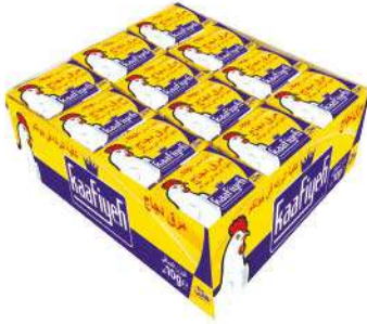
KAAFIYEH CUP CHICKEN BULYON 10 GR

SOSLAR / SAUCES / LA SAUCES صَلصَة / COYU