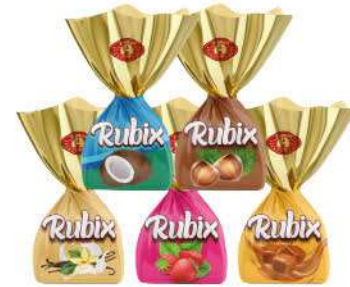
RUBIX SINGLE TWIST CHOCOLATE CARTONS PACK 10 GR