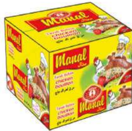
MANAL CHICKEN BOUILLON