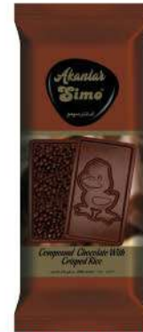
SIMO CHOCOLATE WITH DUCLING FIGURE 60 GR