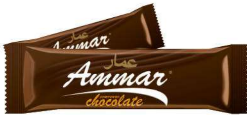
AMMAR TABLET CHOCOLATE 50 GR