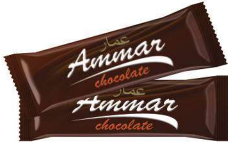
AMMAR TABLET CHOCOLATE 38 GR