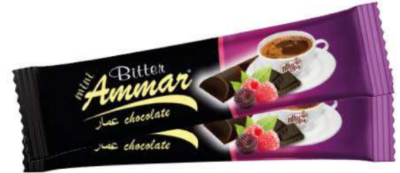
AMMAR RASPBERRY FLAVOURED BITTER CHOCOLATE 7 GR