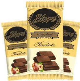
SHARE CHOCOLATE 50 GR