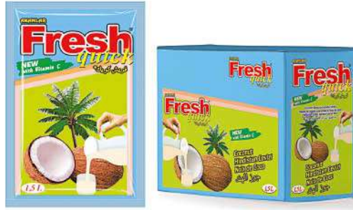
FRESH QUICK POWDER DRINK COCONUT 9 GR