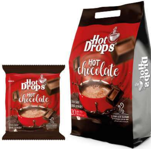
HOT DROPS HOT CHOCOLATE 20 GR

SICAK İÇECEKLER / HOT DRINKS / مشروبات ساخنة BOISSONS CHAUDES / Горячие напитки