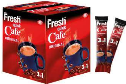
FRESH QUICK CAFE ORIGINAL 3in1 18 GR