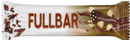
COCOA COATED BITTER FILLED WITH HAZELNUT PARTICULATE COCOLIN 60 GR