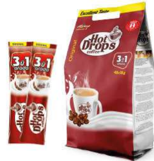
HOT DROPS COFFEE 3 in 1 ORIGINAL 18 GR