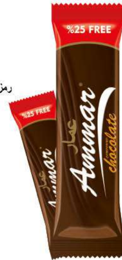
AMMAR COCOA TABLET CHOCOLATE