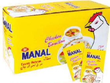
MANAL CHICKEN BOUILLON 10 GR