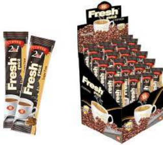
FRESH QUICK COFFEE 2 in 1-12 GR

مشروبات ساخنة / SICAĞI İÇECEKLER / HOT DRINKS / BOISSONS CHAUDES / Горячие напитки