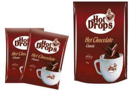
HOT DROPS HOT CHOCOLATE 20 GR