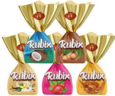
RUBIX SINGLE TWIST CHOCOLATE NYLON PACK 10 GR