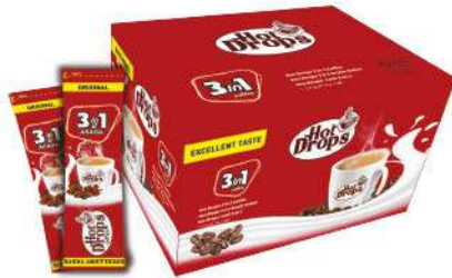
HOT DROPS COFFEE 3 in 1 ORIGINAL 10 GR