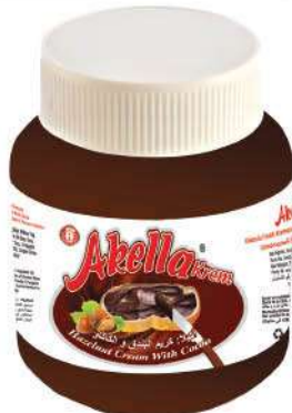
AKELLA SPREAD CREAM CHOCOLATE 350 GR