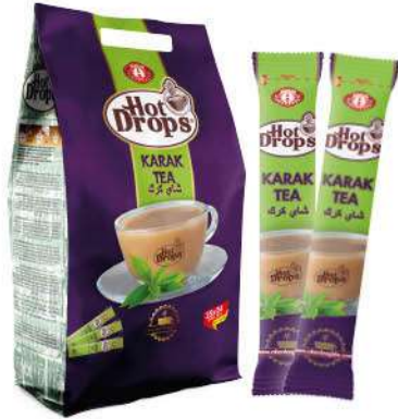
HOT DROPS KARAK TEA 20 GR

SICAK İÇECEKLER / HOT DRINKS / مشروبات ساخنة BOISSONS CHAUDES / Горячие напитки