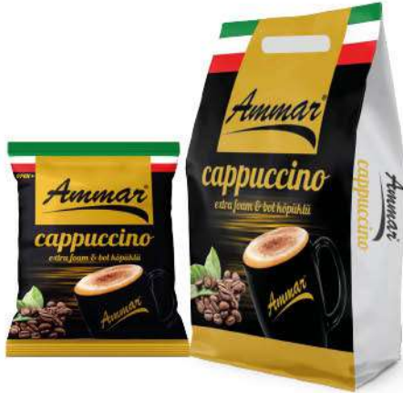
AMMAR GRANULE CAPPUCCINO 25 GR

SICAK İÇECEKLER / HOT DRINKS / مشروبات ساخنة BOISSONS CHAUDES / Горячие напитки