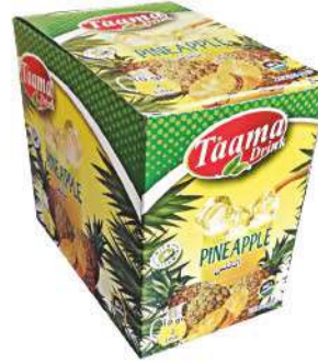
TAAMA POWDER DRINK PINEAPPLE 10 GR