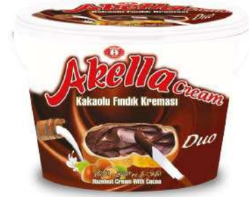
AKELLA SPREAD CREAM CHOCOLATE DUO 800 GR