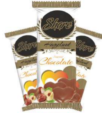
SHARE CHOCOLATE 60 GR