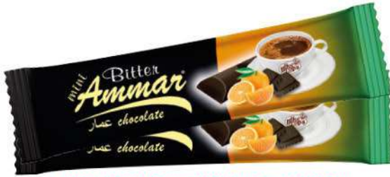
AMMAR ORANGE FLAVOURED BITTER CHOCOLATE 7 GR