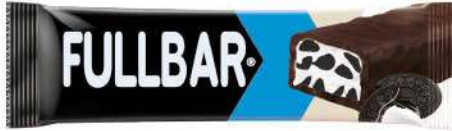
FULLBAR CREAM-FILLED COCOA BISCOIT-PARTICLE CHOCOLATE