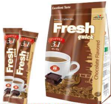
FRESH QUICK COFFEE 3 in 1 WITH CHOCOLATE 18 GR