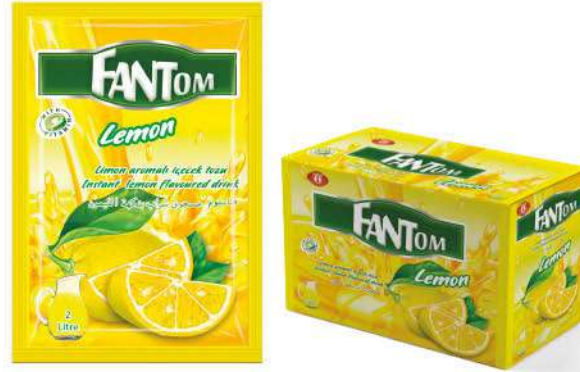
FANTOM POWDER DRINK LEMON 9 GR