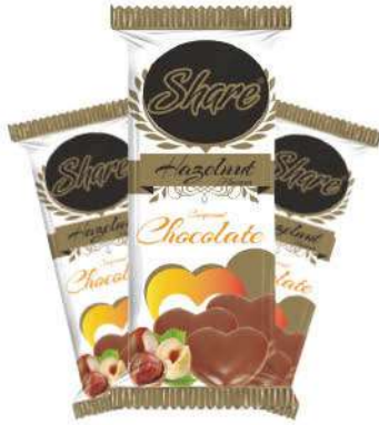
SHARE CHOCOLATE 77 GR