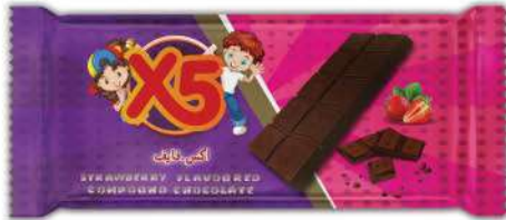
X5 STRAWBERRY FLAVOURED COMPOUND CHOCOLATE 25 GR