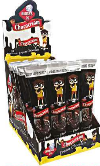
ALMAS 99 SPREAD TUBE CHOCOLATE 30 GR

شوكولاته / CHOKOLATALAR / CHOCOLATES / шоколад