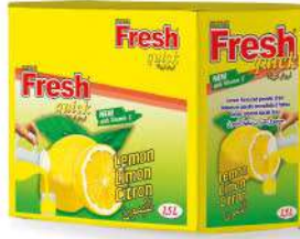
FRESH QUICK POWDER DRINK LEMON 9 GR