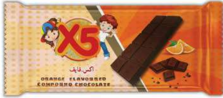
X5 ORANGE FLAVOURED COMPOUND CHOCOLATE 25 GR