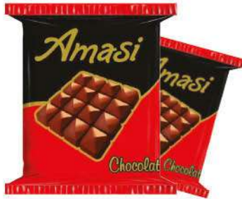
AMASI CHOCOLATE 67 GR

ÇIKOLATALAR / CHOCOLATES / شوكولاته CHOCOLATS / шоколад