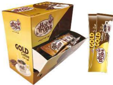
HOT DROPS COFFEE 2 GR