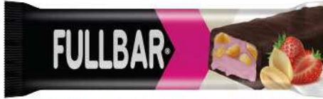
COCOA COATED STRAWBERRY FLAVOUR INNER WITH PEANUT COCOLIN