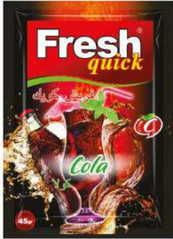
FRESH QUICK POWDER DRINK COLA 45 GR