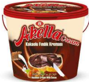
AKELLA SPREAD CREAM CHOCOLATE 400 GR