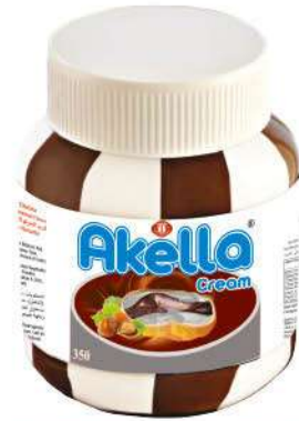
AKELLA SPREAD CREAM CHOCOLATE DUO 350 GR