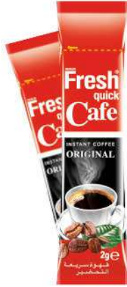
FRESH QUICK COFFEE CLASSIC 2 GR

SICAK İÇECEKLER / HOT DRINKS / مشروبات ساخنة BOISSONS CHAUDES / Горячие напитки