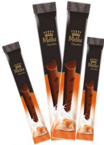
MELIKE CHOCOLATE WITH CARAMEL 28 GR