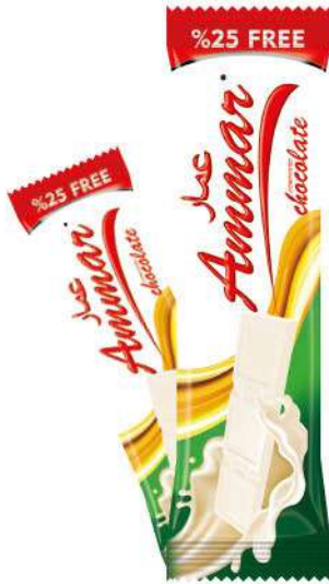
AMMAR MILKY TABLET CHOCOLATE

ÇİKOLATALAR / CHOCOLATES / شركة لاته CHOCOLATS / шоколад