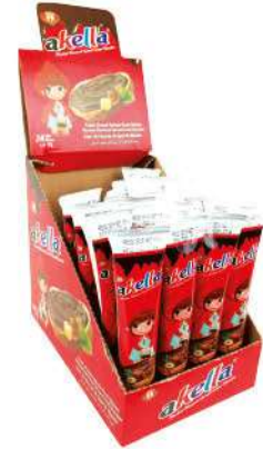
AKELLA SPREAD TUBE CHOCOLATE 15 GR