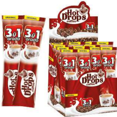
HOT DROPS COFFEE 3 in 1 ORIGINAL 18 GR

SICAK İÇECEKLER / HOT DRINKS / مشروبات ساخنة BOISSONS CHAUDES / Горячие напитки