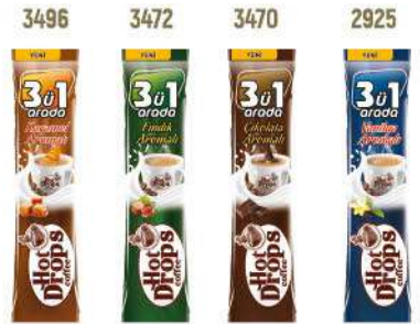
HOT DROPS COFFEE 3 in 1 WITH 18 GR