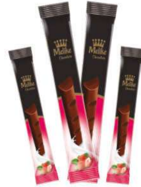
MELIKE CHOCOLATE WITH STRAWBERRY 28 GR