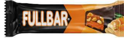
COCOA COATED ORANGE FLAVOUR INNER WITH PEANUT COCOLIN 60 GR