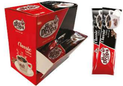
HOT DROPS COFFEE CLASSIC 2GR