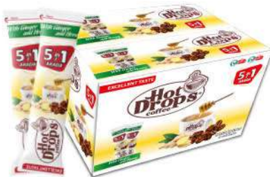
HOT DROPS 5in1 BALLI ZENCEFİLLİ 18 GR