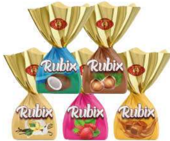
RUBIX SINGLE TWIST CHOCOLATE CARTONS PACK 10 GR