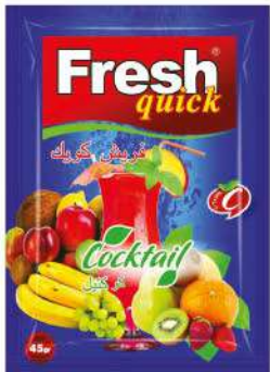
FRESH QUICK POWDER DRINK COCKTAIL 45 GR