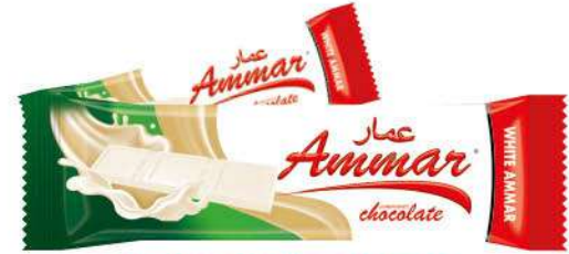
AMMAR TABLET MILKY CHOCOLATE 38 GR