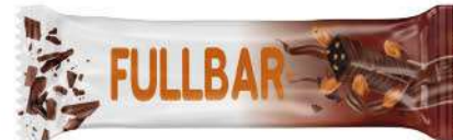
COCOA COATED BITTER FILLED WITH ALMOND PARTICULATE COCOLIN 60 GR