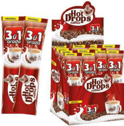
HOT DROPS COFFEE 3 in 1 ORIGINAL 18 GR

SICAK İÇECEKLER / HOT DRINKS / مشروبات ساخنة BOISSONS CHAUDES / Горячие напитки