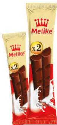
MELIKE X2 CHOCOLATE 50 GR