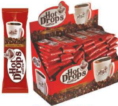
HOT DROPS COFFEE 2 GR

SICAK İÇECEKLER / HOT DRINKS / مشروبات ساخنة BOISSONS CHAUDES / Горячие напитки