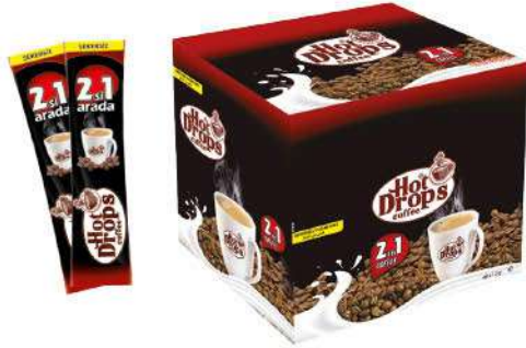
HOT DROPS COFFEE 2 in 1-12 GR

SICAK İÇECEKLER / HOT DRINKS / مشروبات ساخنة BOISSONS CHAUDES / Горячие напитки