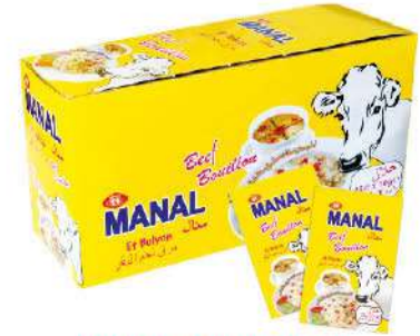
MANAL MEAT BOUILLON 10 GR