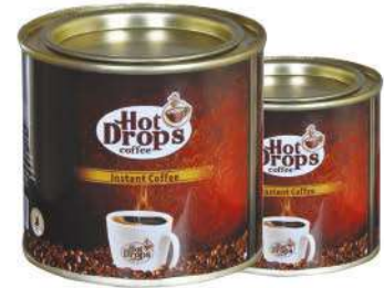
HOT DROPS INSTANT COFFEE 50 GR