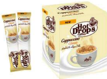
HOT DROPS CAPPUCCINO 15 GR