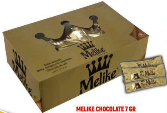
MELIKE CHOCOLATE 7 GR