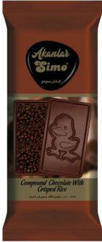
SIMO CHOCOLATE WITH DUCLING FIGURE 77 GR

ÇIKOLATALAR / CHOCOLATES / شوكولاته CHOCOLATS / шоколад