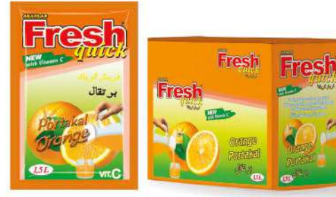
FRESH QUICK POWDER DRINK ORANGE 9 GR