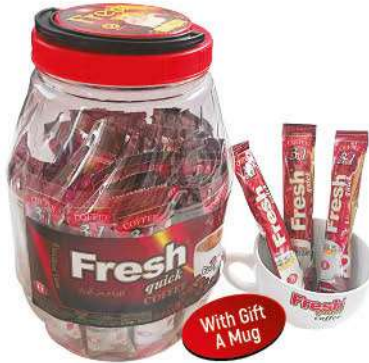
FRESH QUICK 3 in 1 COFFEE 18 GR IN JAR