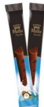
MELIKE CHOCOLATE WITH COCONUT 28 GR