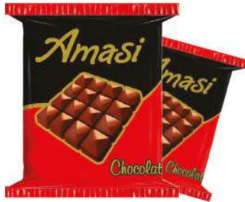
AMASI CHOCOLATE 50 GR