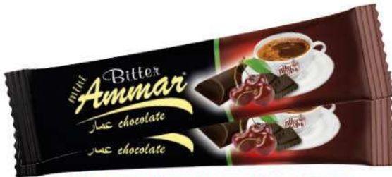
AMMAR CHERRY FLAVOURED BITTER CHOCOLATE 7 GR