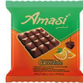
AMASI COMPOUND CHOCOLATE WITH ORANGE FLAVOUR 50 GR