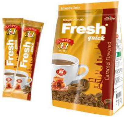
FRESH QUICK COFFEE 3 in 1 WITH CARAMEL 18 GR

SICAK İÇECEKLER / HOT DRINKS / مشروبات ساخنة BOISSONS CHAUDES / Горячие напитки