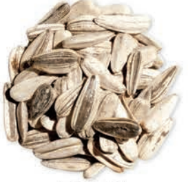
Ay Çekirdeği Sunflower Seeds بذور دوار الشمس