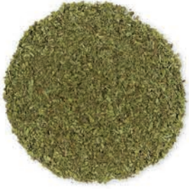
Nane Mint نعناع