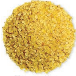
Midyat Orta Bulgur Medium Bulgur برغل وسط