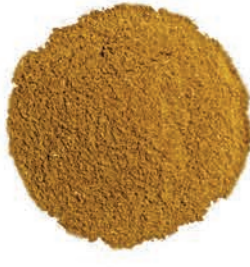
Kimyon Cumin كمون