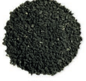
Çörek Otu Black Cumin كمون اسود (حبة البركة)