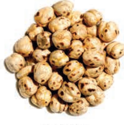
Sarı Leblebi Yellow Chickpeas قضامة صفراء