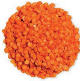
Kırmızı Mercimek Yaprak Red Lentils عدس احمر مجروش