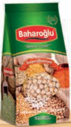
900 g Kutu Ambalaj