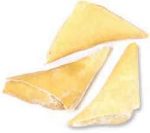
Fıstıklı Muska Triangularly folded grape pulp with pistachio paste in ثائمم الفستق