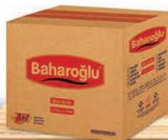
2,5 Kg x 7 Adet