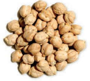
Nohut Chickpeas حمص