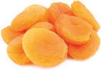
Kuru Kayısı Dried apricot pulp مشمش مجفف