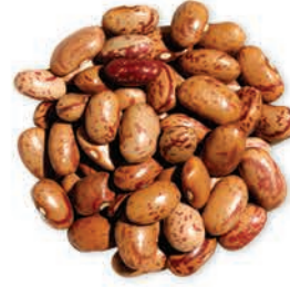
Barbunya Red Kidney Beans فاصولیا الباریونیه