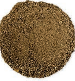
Karabiber Black Pepper قلفل اسود