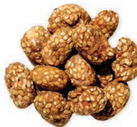
Şekerli Leblebi Sweet Chickpeas قضامة حلوة