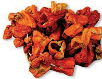
Dolmalık Biber Fried ball pepper for stuffing الفلفل المجفف