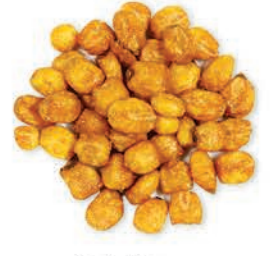
Soslu Mısır Corn With Sauce شيبس الذرة المحمصة