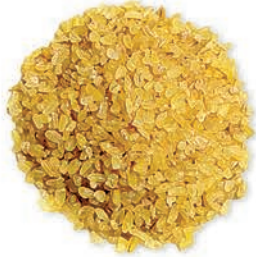
Pilavlık Bulgur Coarse Bulgur برغل خشن