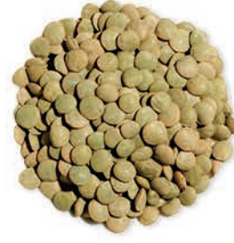
Yeşil Mercimek Green Lentils عدس اخضر