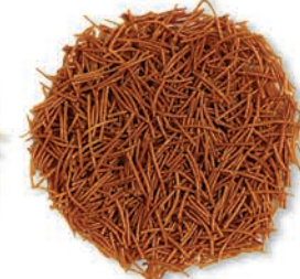
Kavrulmuş Tel Şehriye Roasted Vermicelli شعيرية محمصّة