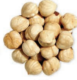
Fındık Hazelnut بندق