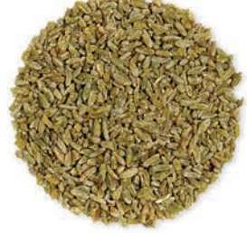
Frik Freekeh فريكة