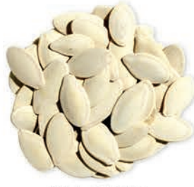
Kabak Çekirdeği Pumpkin Seeds بذور اليقطين (القرع)