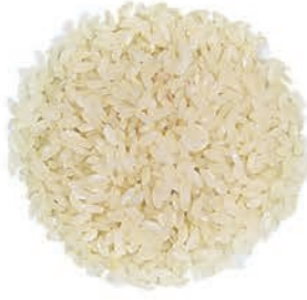
Osmancık Pirinci Osmancık Rice أرز عثمانی