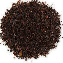
İsot Biber Isot Pepper قلفل أسود (شبهوتل)