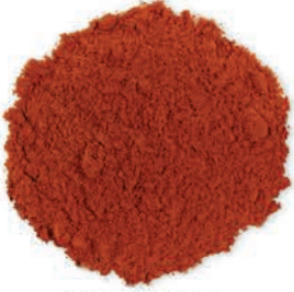
Kırmızı Toz Biber Red Powder Pepper مسحوق القلفل الأحمر