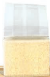
Vakumlu İrmik Ambalajı - Vacuum Semolina Packaging