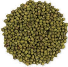
Maş Mung اللوبیة الشعاعیة (الماش)