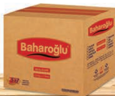
5 Kg x 5 Adet