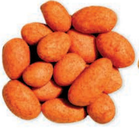
Soslu Çerez Nuts With Sauce شيبس الذرة المنكهة