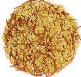
Şehriyeli Pilavlık Bulgur Coarse Vermicelli برغل خشن بالشعيرية