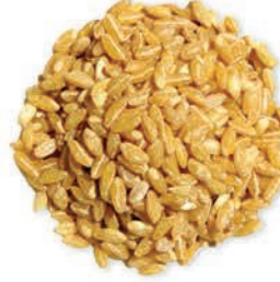
Kırmızı Aşurelik Buğday Red Pounded Wheat حنطة عاشوراء حمراء