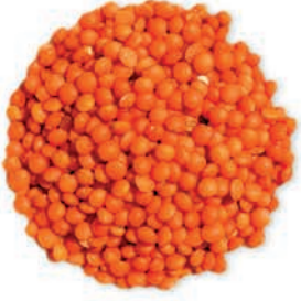
Kırmızı Mercimek Futbol Red Lentils عدس احمر فوتبول