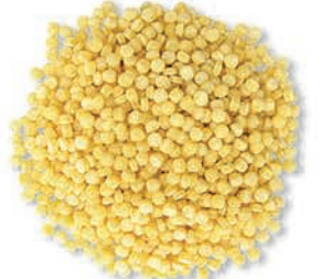
Kuskus Couscous الكسكس