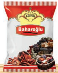
OPP Kuruluk Ambalaj