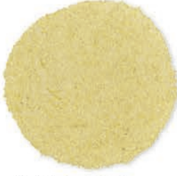
Buğday İrmigi 0 Numara Wheat Semolina # 0 سميد القمح نمرة (0)