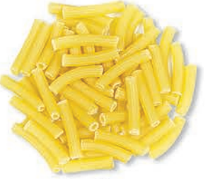
İnce Kesme Thin Cutting الاصابع الرقيقة