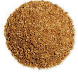
Esmer Köftelik Bulgur Brown Fine Bulgur برغل ناعم اسمر