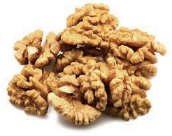
Ceviz Walnut جوز