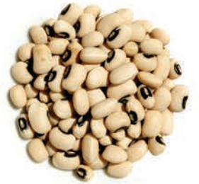
Loğlaz (Kuru Börülce) Black Eyed Beans لوبیة