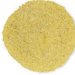
Buğday İrmigi 3 Numara Wheat Semolina # 3 سميد القمح نمرة (3)