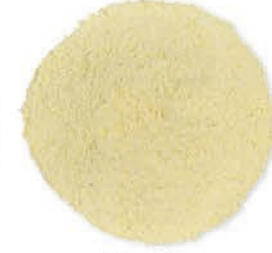
Mısır Unu Corn Flour طحين الذرة