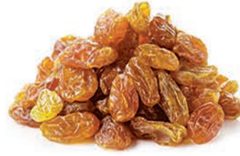
Kuru Üzüm Dried raisin عنب مجفف (الزبيب)