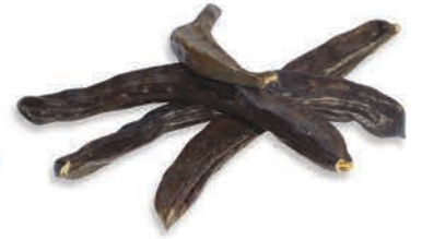
Keçiboynuzu Meyvesi Carob fruit ثمره الخروب