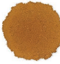
Tarçın Cinnamon قرفة