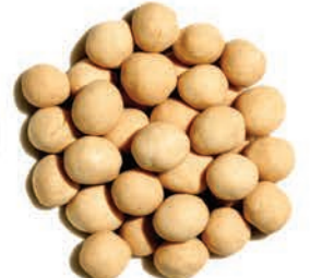
Çıtır Leblebi Crispy Chickpeas قضامة مقرمشة