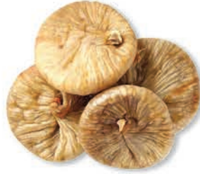
Kuru İncir Dried fig pulp تين مجفف