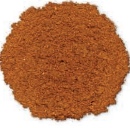
Köfte Baharatı Meat Spice بهارات اللحوم