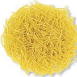
Tel Şehriye Vermicelli شعيرية