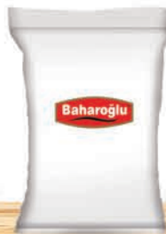
4 Kg x 8 Adet