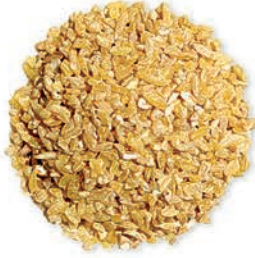
Şişe Bulgur (Kalın Ceris) Coarse Jareesh Bulgur جریش خشن