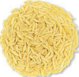
Arpa Şehriye Barley Noodle شعيرية لسان عصفور