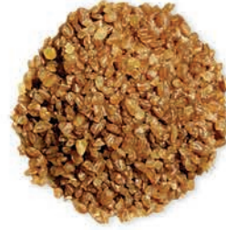
Esmer Pilavlık Bulgur Brown Coarse Bulgur برغل خشن اسمر