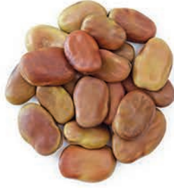
Bakla Broad Beans فول