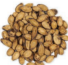
Karpuz Çekirdeği Watermelon Seeds بذور البطيخ