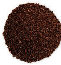
Sumak Sumach السماق