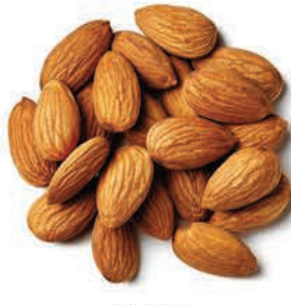
Badem Almond لوز