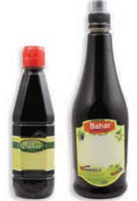
Nar Pekmezi Pomegranate Syrup ديس الرمان