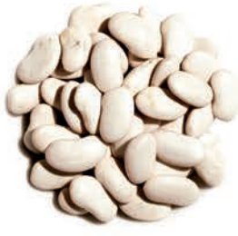
Kuru Fasulye White Beans فاصولیا