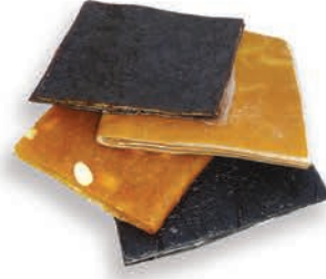
Üzüm Pestili Dried grape pulp لب العنب المجفف