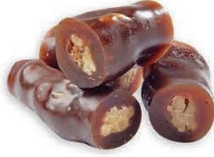
Cevizli üzüm sucuğu Grape molasses coated nuts حلويات سق العنب بالجوز