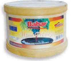
Katı Külek Pekmezi Solid Grape Molasses ديس العنب المركز