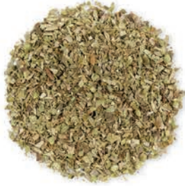
Kekik Thyme زعتر