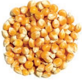
Patlatmalık Mısır Corn الذرة