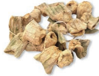
Dolmalık Kabak Dried zucchini for stuffing كوسا مجفف