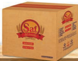
5 Kg x 5 Adet