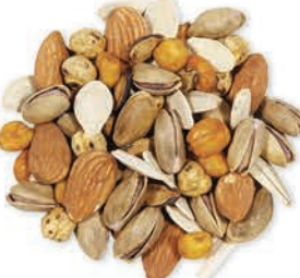
Kokteyl Çerez Mixed Nuts مكسرات مشكلة