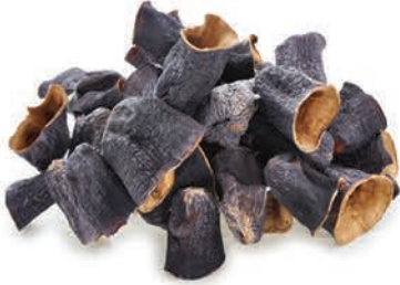
Dolmalık Patlıcan Dried eggplant for stuffing بادنجان مجفف