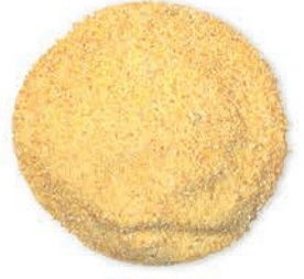
Mısır İrmigi Corn Semolina سميد الذرة