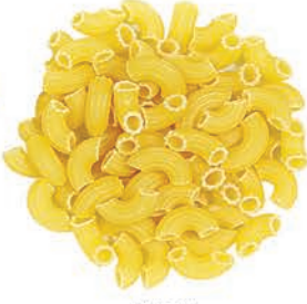
Dirsek Elbow كوع