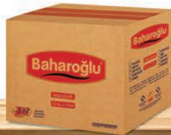
50 x 20 Adet Kuruluk Kolisi