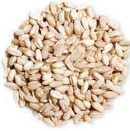
Beyaz Aşurelik Buğday White Pounded Wheat حنطة عاشوراء بيضاء