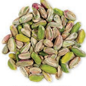
Antep Fıstığı Kabuksuz Pistachio فستق عنتابی مقشور