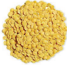
Sarı Mercimek Yellow Lentils عدس اصفر