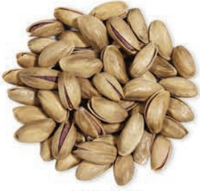
Antep Fıstığı Pistachio فستق عنتابی غیر مقشور