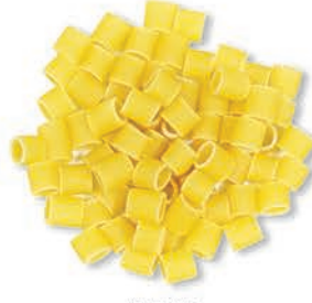
Yüksük Thimble كشتبان