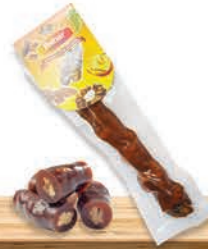
Tekli Vakumlu Sucuk