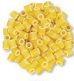
Boncuk Bead خرز