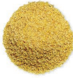
Köftelik Bulgur Fine Bulgur برغل ناعم