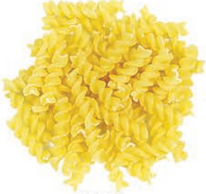
Burgu Bract الولبية