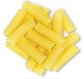
Kalın Kesme Thick Cutting الاصابع السميقة