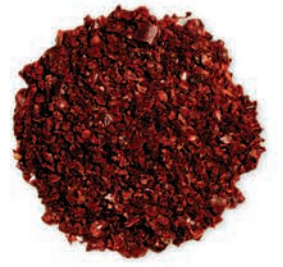
Kırmızı Pul Biber Red Leaf Pepper القلفل الأحمر