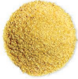
Sefer Kite (Ceris) Sefelkitel Jareesh Bulgur جریش ناعم