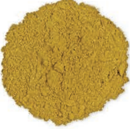
Köri Curry كاري