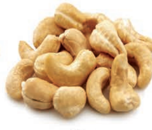
Kaju Cashew كاجو